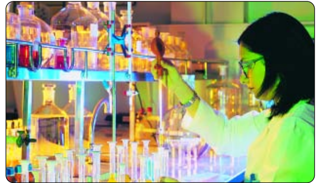
Kanserin Psikiyatrik Yönleri (Psikoonkoloji)

(1) Charles M. Caruso, International Patent Counsel, MSD